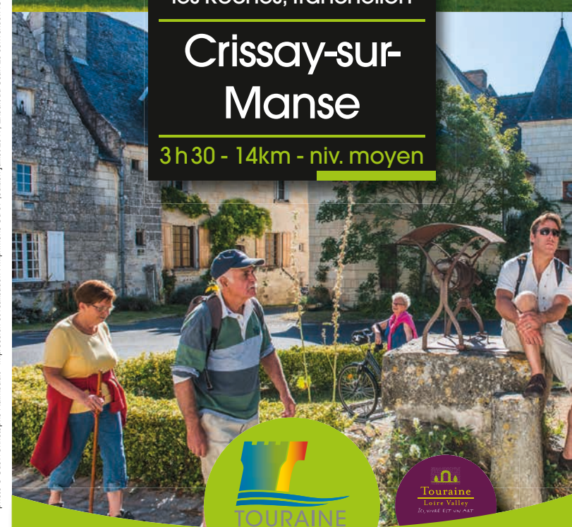
impression et réalisation - Impression Cd 37 - édition juillet 2017. Extrait du Scan 25 convention IGV400970 - n°609

UN LABEL DU CONSEIL DÉPARTEMENTAL D'INDRE-ET-LOIRE