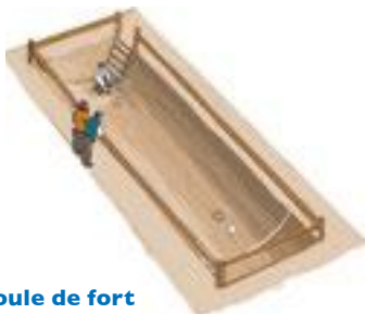
B-La boule de fort