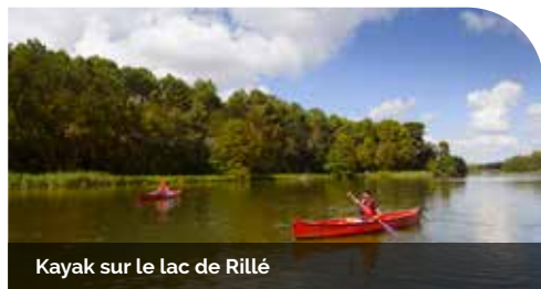
Kayak sur le lac de Rillé