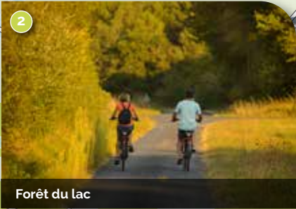
Forêt du lac