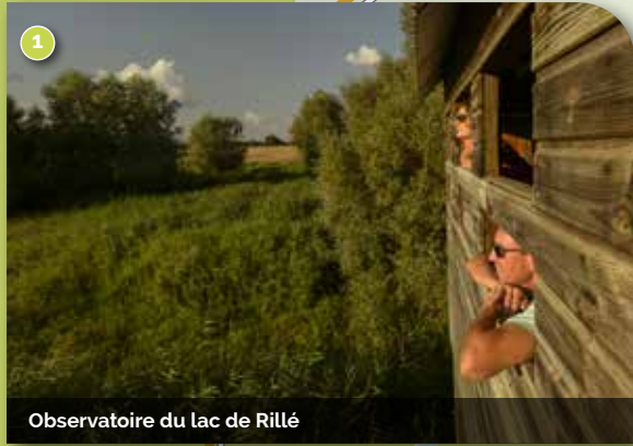
Observatoire du lac de Rillé