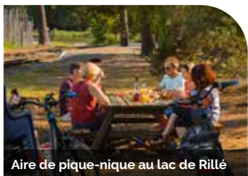
Aire de pique-nique au lac de Rillé