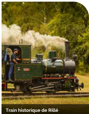
Train historique de Rillé