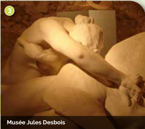
Musée Jules Desbois