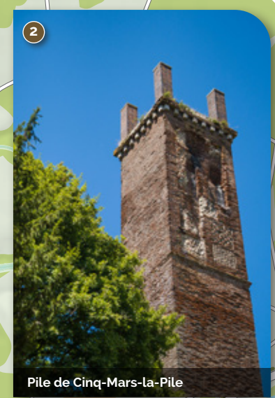
Pile de Cinq-Mars-la-Pile