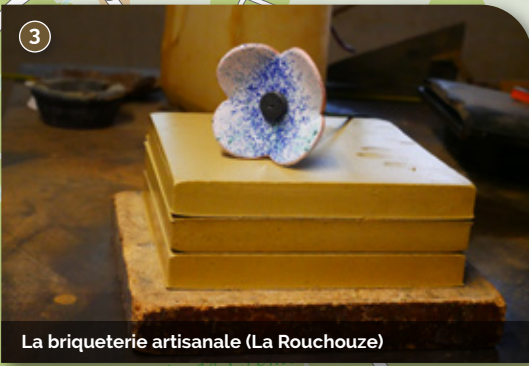
La briqueterie artisanale (La Rouchouze)