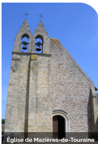
Église de Mazières-de-Touraine