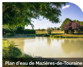
Plan d'eau de Mazières-de-Touraine