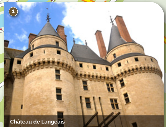
Château de Langeais