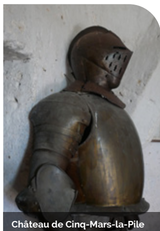
Château de Cinq-Mars-la-Pile