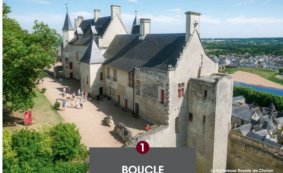
La Forteresse Royale de Chinon