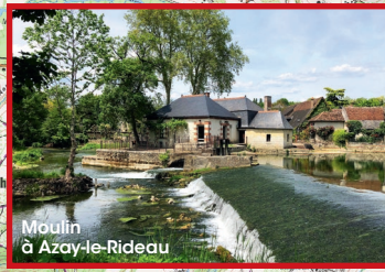
Moulin à Azay-le-Rideau