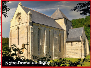
Notre-Dame de Rigny