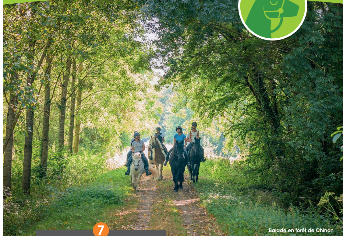
Balade en forêt de Chinon