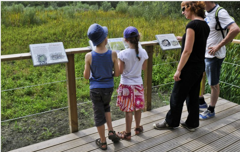
Panneaux d'interprétations (Commune Loire - Authion)

Balades et randos région de Loire-Authion - Loire-Authion