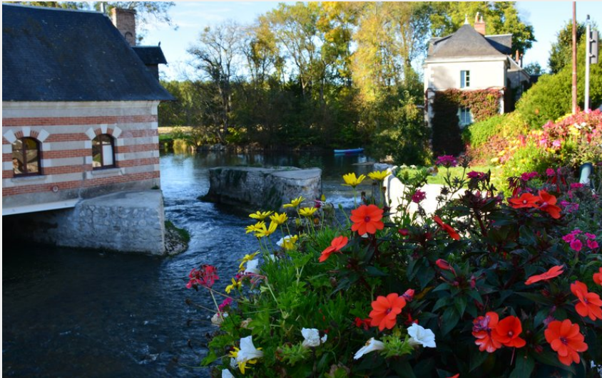
Artannes-sur-Indre (Aurore Poveda)