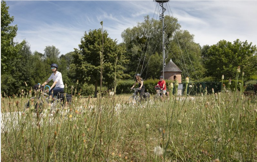
Eolienne Bolée d'Esvres (David Darrault)