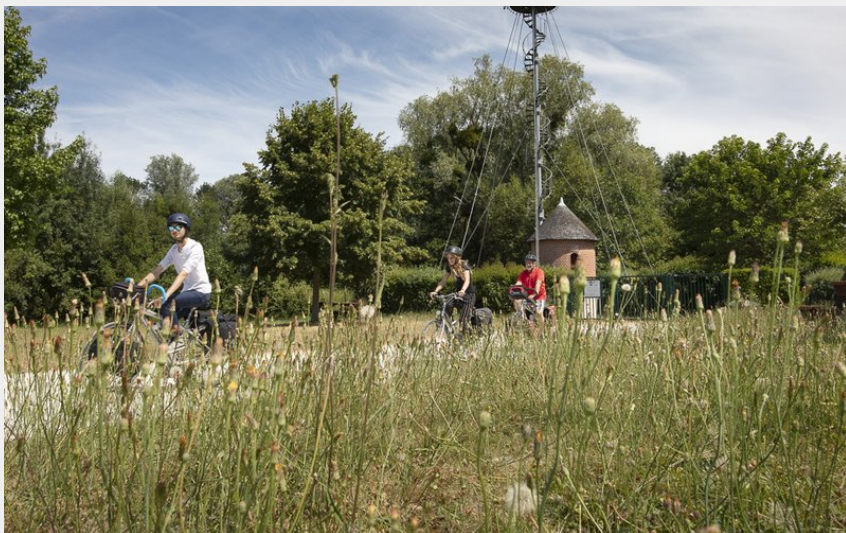
Eolienne Bolée d'Esvres (David Darrault)