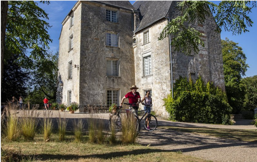
Château de Saché - Musée Balzac (David Darrault)

Balades et randos région d'Azay-le-Rideau - Saché