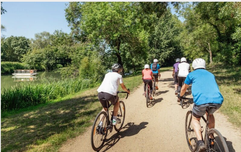
Circuit Gravel - vue sur le Bac de la Chevalerie

Balades et randos région de Loire-Authion - Angers