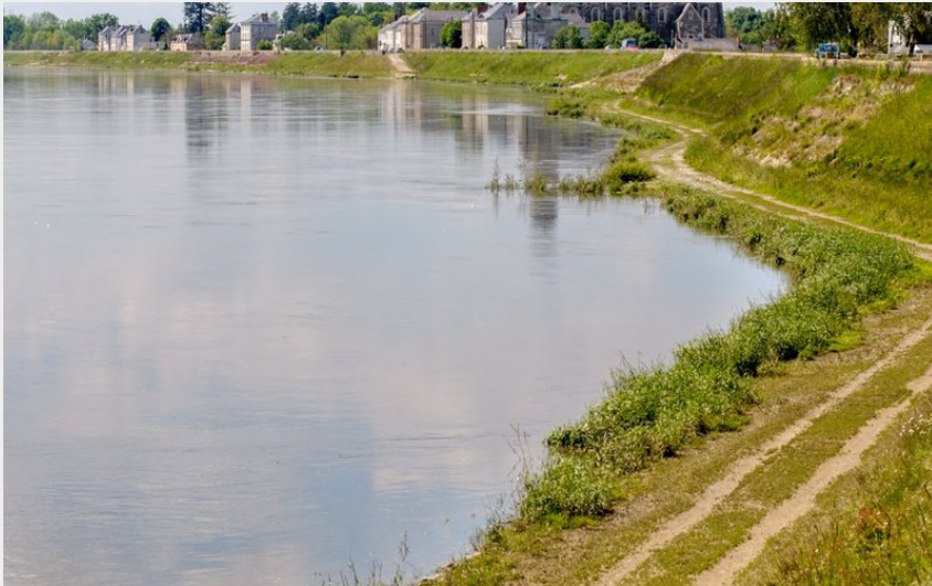
Panorama sur la Loire (Commune Loire - Authion)