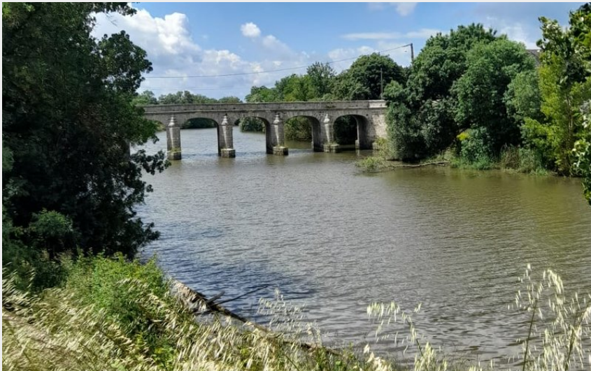
Panorama sur le Pont de Sorges (Commune Loire - Authion)