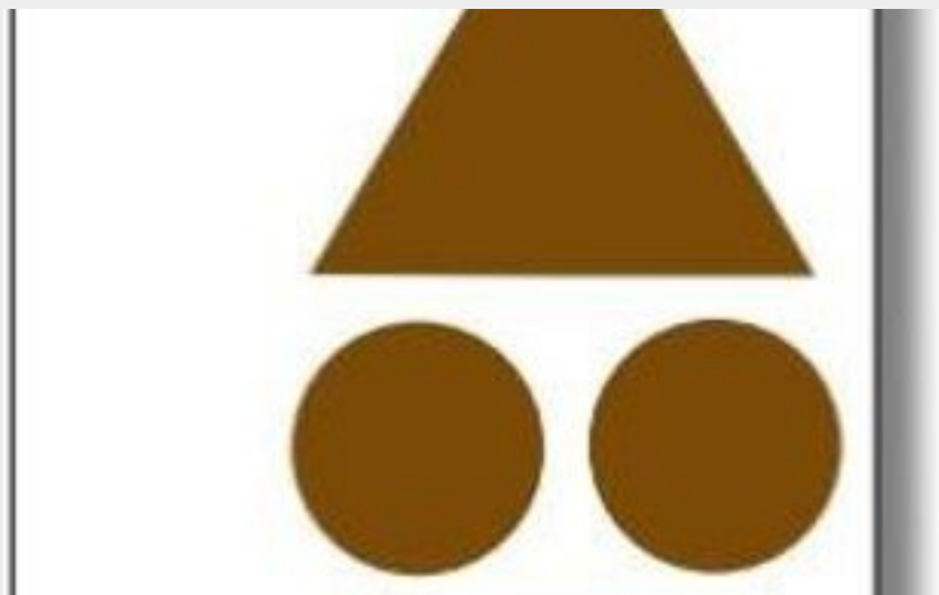
Balises des circuits VTT (Commune Loire - Authion)