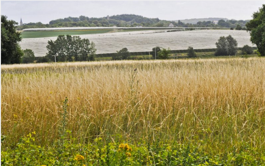
Champ de maïs