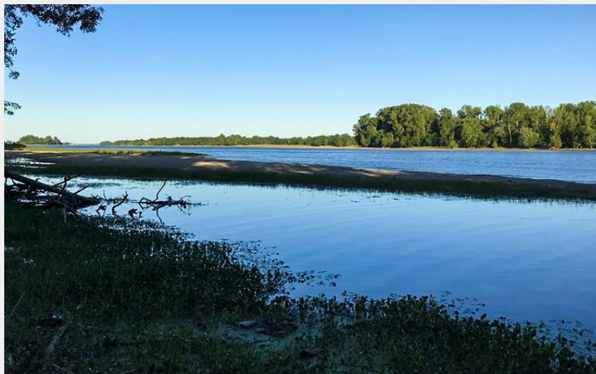
Bord de Loire (Commune Loire - Authion)