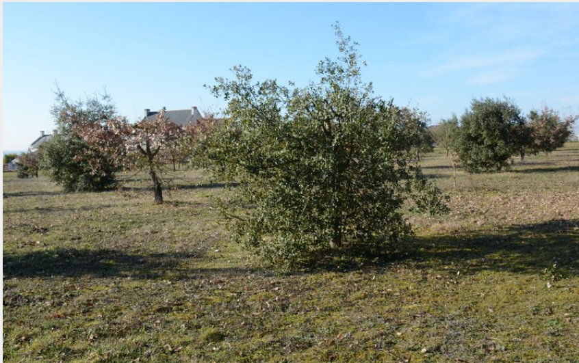
Photographie d'une truffière au moment de la récolte