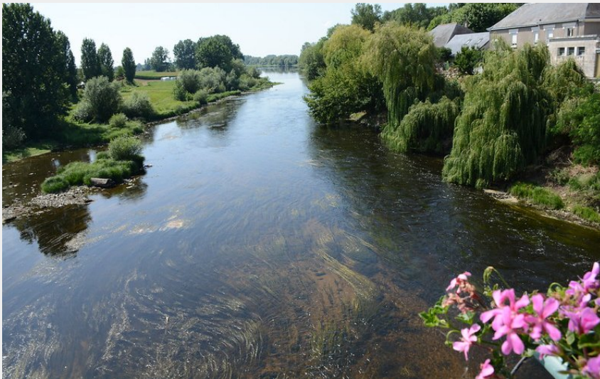
Photographie de la Vienne (Aurore Poveda)