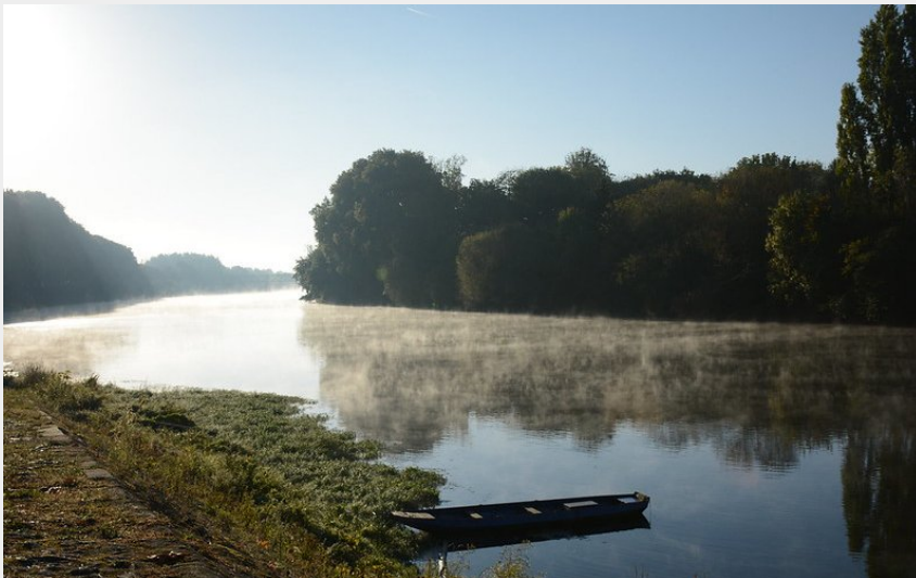
Brume matinale sur la Vienne (Aurore Poveda)