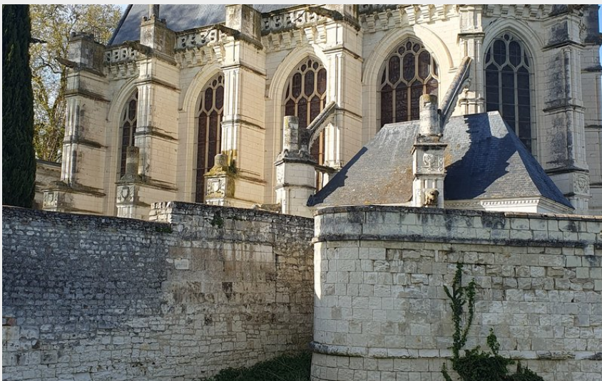
Photographie de la Sainte Chapelle de Champigny-sur-Veude