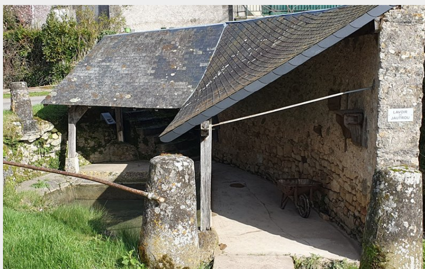
Photographie du lavoir du Jautrou, l'un des nombreux lavoirs sur cette randonnée.

Balades et randos région de Richelieu/Ile-Bouchard/Sainte Maure - Avon-les-Roches