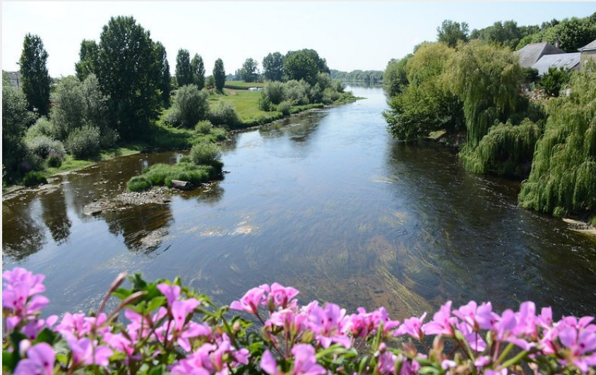
Photographie de la Vienne (Aurore Poveda)