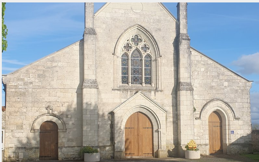
Photo de l'église de La Tour-Saint-Gelin