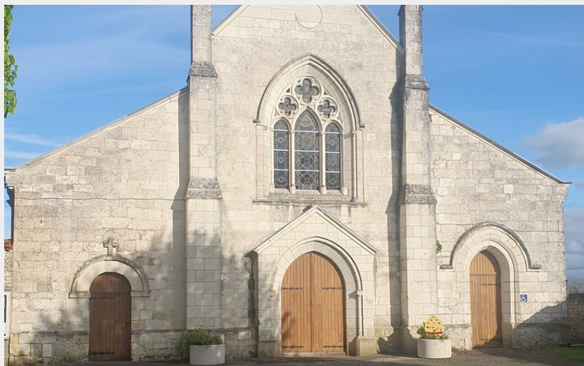
Photo de l'église La-Tour-Saint-Gelin