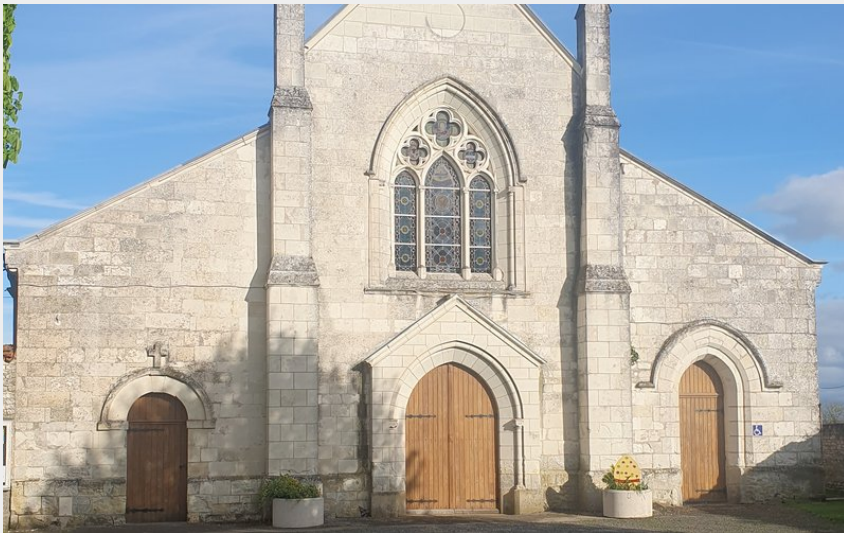
Photo de l'église La-Tour-Saint-Gelin