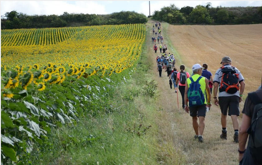
Randonneurs et champ de tournesols (Aurore Poveda)