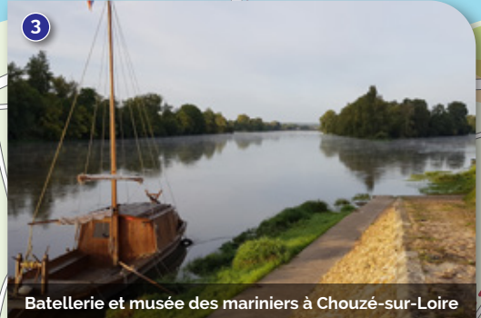
Batterie et musée des mariners à Chouzé-sur-Loire