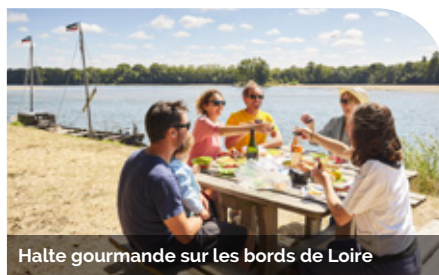
Halte gourmande sur les bords de Loire