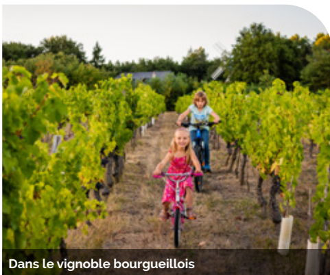
Dans le vignoble bourgueillois