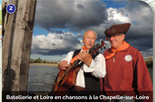
Batterie et Loire en chansons à la Chapelle-sur-Loire