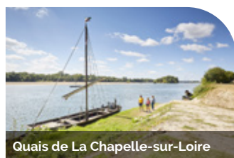
Quais de La Chapelle-sur-Loire