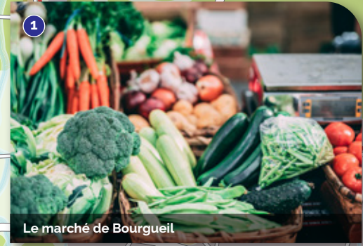
Le marché de Bourgueil