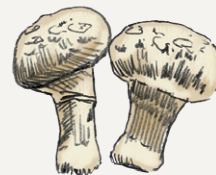
Champignon de Paris

Parmi ces 3 champignons, l'un d'eux n'est pas cultivé en cave troglodytique. Saurez-vous le retrouver ?