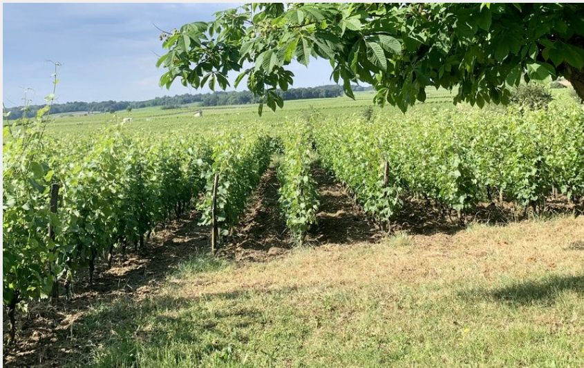
Vignoble à Parnay (Aude Genevoise)