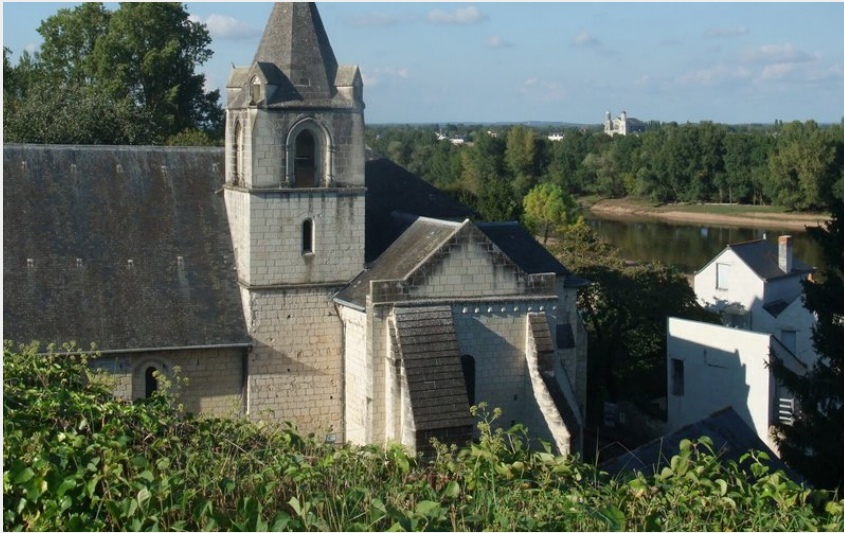
Village de Trèves (K. Lemeitour)