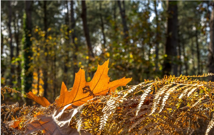
Forêt (G. Angibaud)