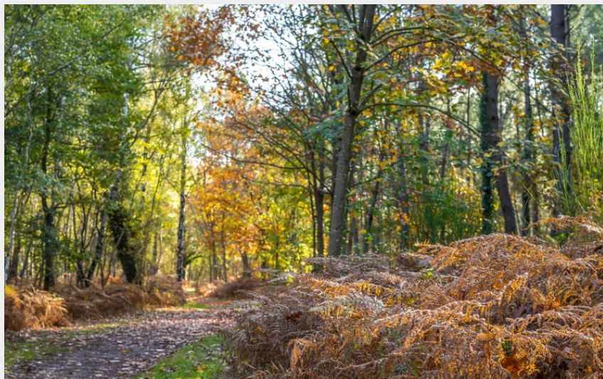
Fôret (G. Angibaud)