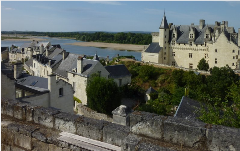
Vue château de Montsoreau (Sophie Lecerf)