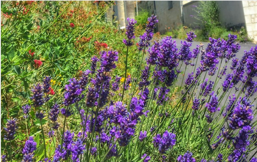
Lavande (Aude Genevoise)