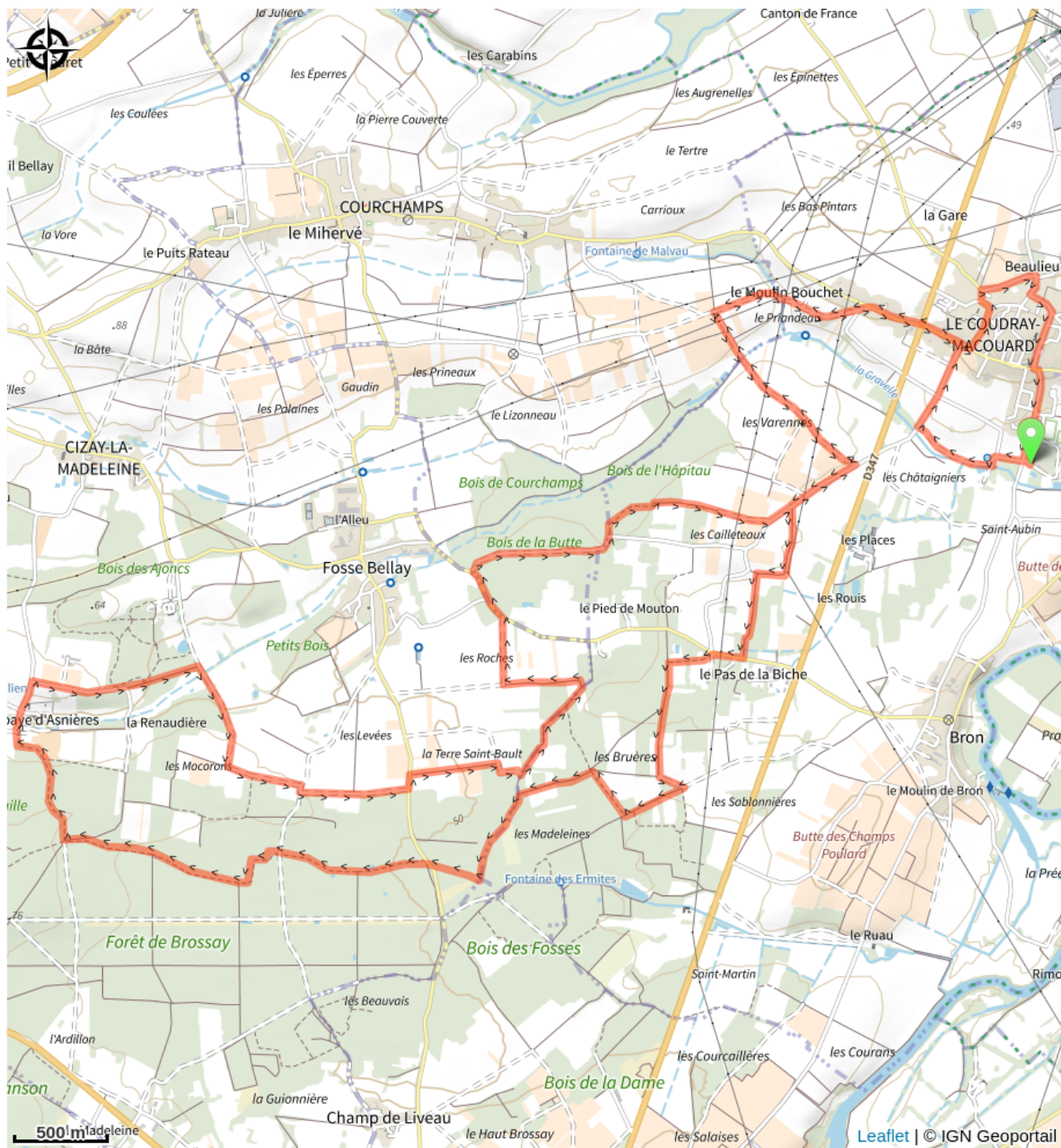
📍 La Seigneurie du Bois (A)