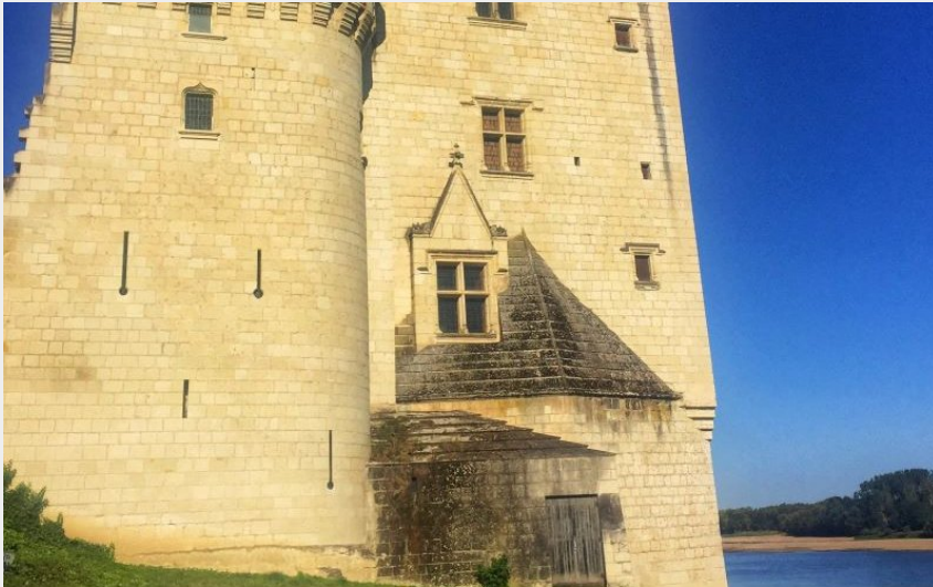
Montsoreau (Aude Genevaise - SPL-SVLT)