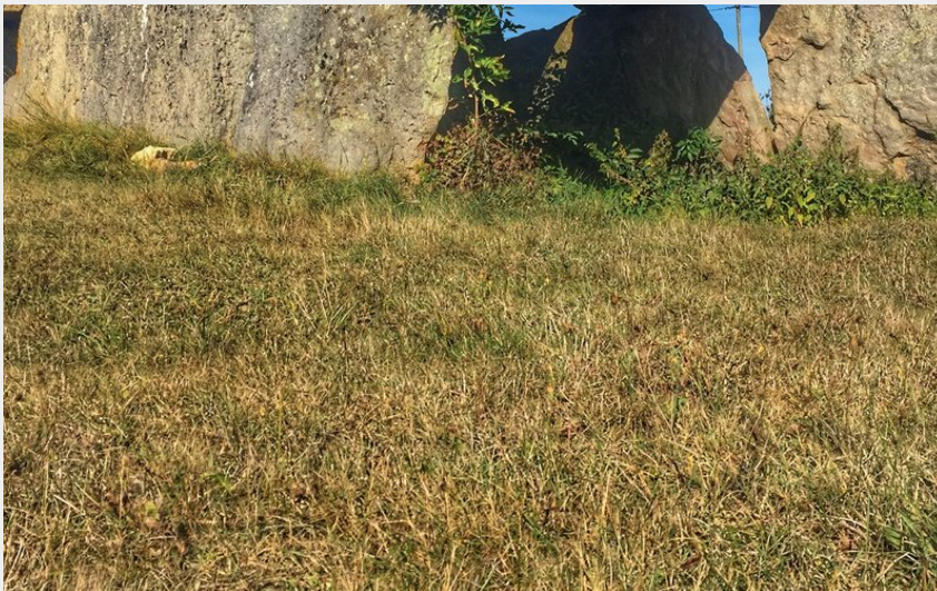
Dolmen à Gennes (A. Genevoise)

Balades et randos région de Saumur - Gennes-Val-de-Loire