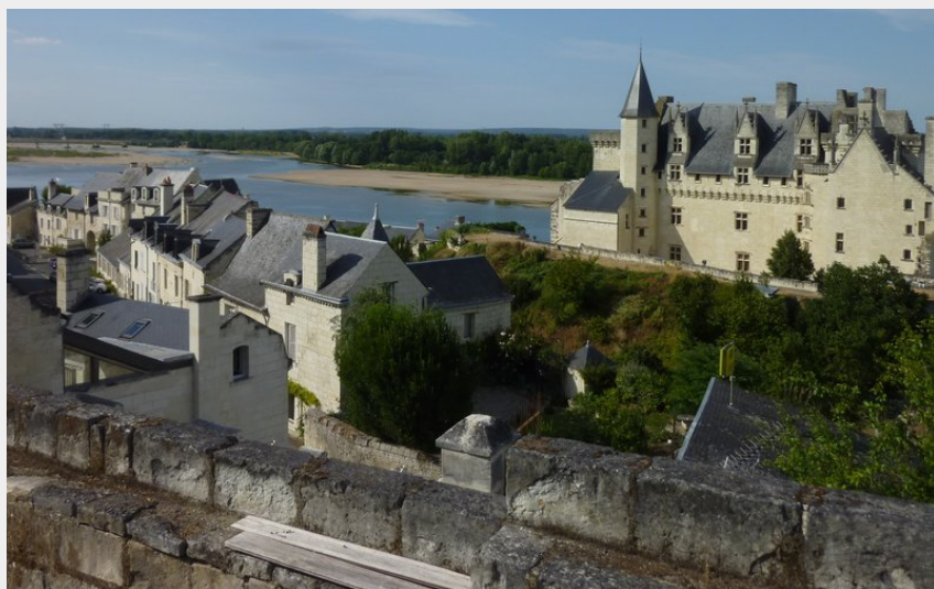
Vue château de Montsoreau (Sophie Lecerf)

Balades et randos région de Saumur - Turquant