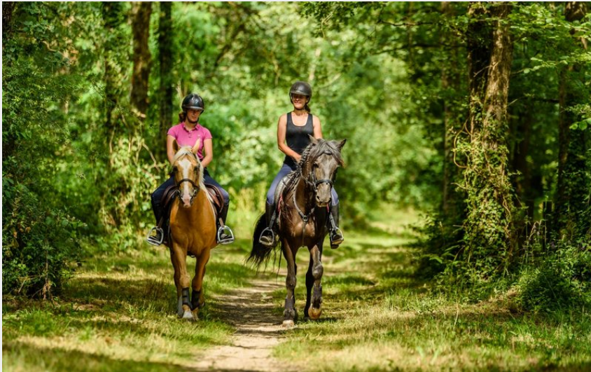
(Collectif F4 - Vincent Dhetine)