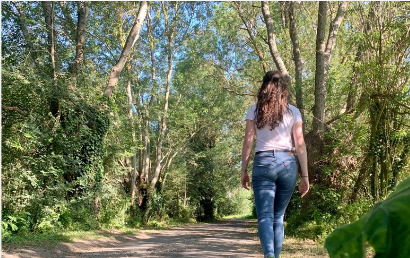
Randonnée en forêt (Aude Genevaise - SPL-SVLT)