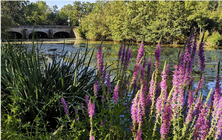
Bords du Layan (S. Rochelet)

Balades et randos région de Saumur - Doué-en-Anjou