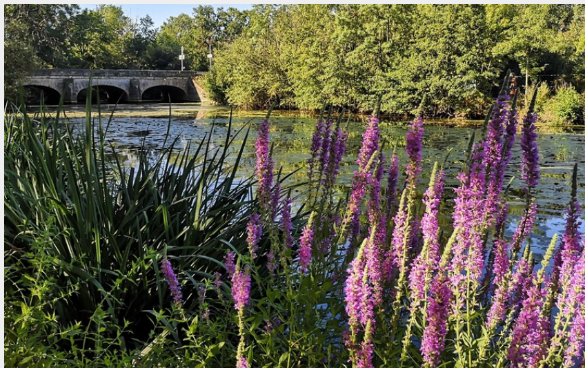
Bords du Layon (S. Rochelet)

Balades et randos région de Saumur - Doué-en-Anjou