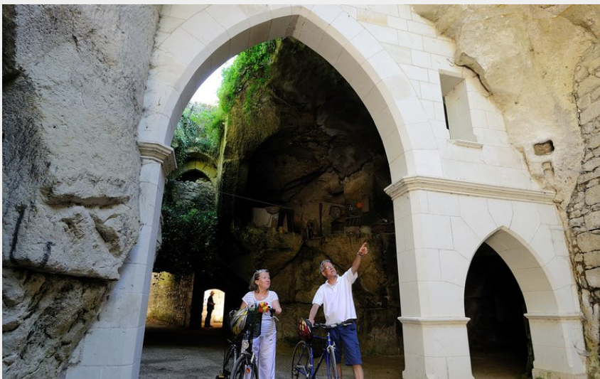
Dans les troglos (J.S Evrard)