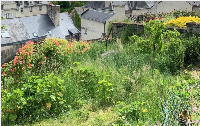
(Aude Genevaise - SPL-SVLT)

Balades et randos région de Saumur - Montsoreau