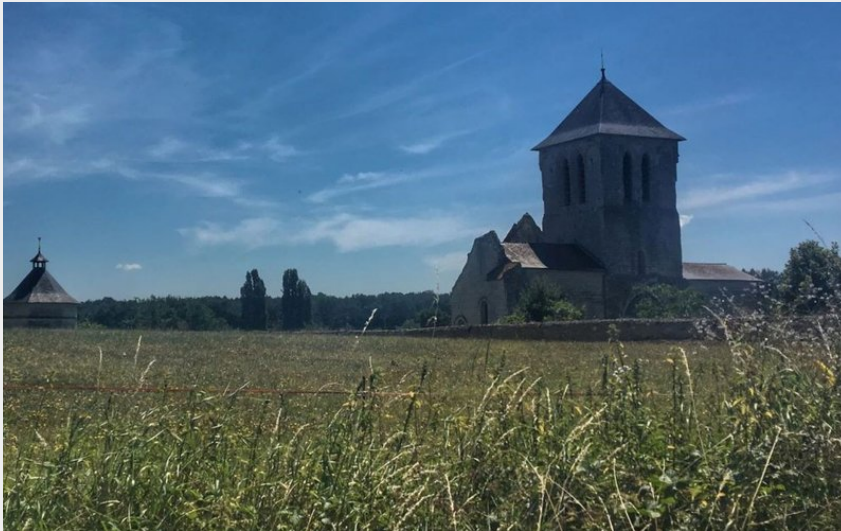
Abbaye d'Asnières (Aude Genevaise - SPL-SVLT)