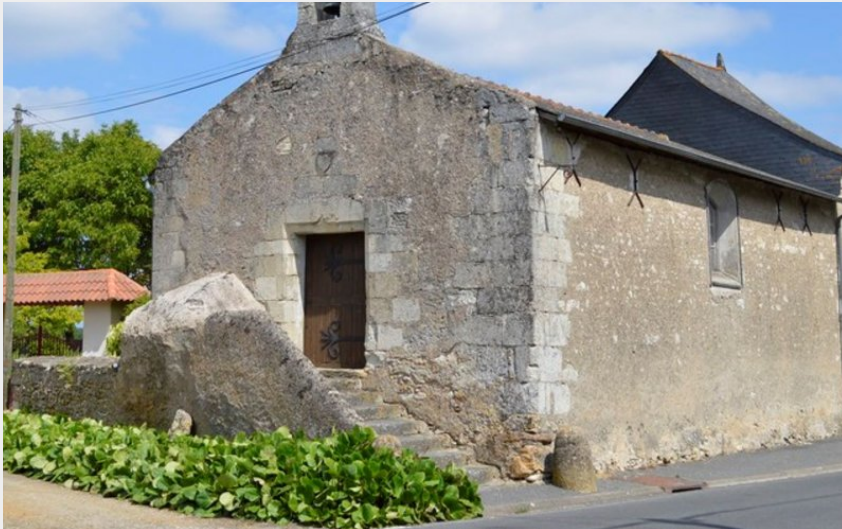
(OT du Saumurois)