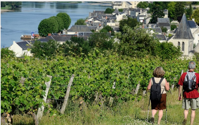
Randonneurs dans le Vignoble (J.S Evrard)

Balades et randos région de Saumur - Montsoreau