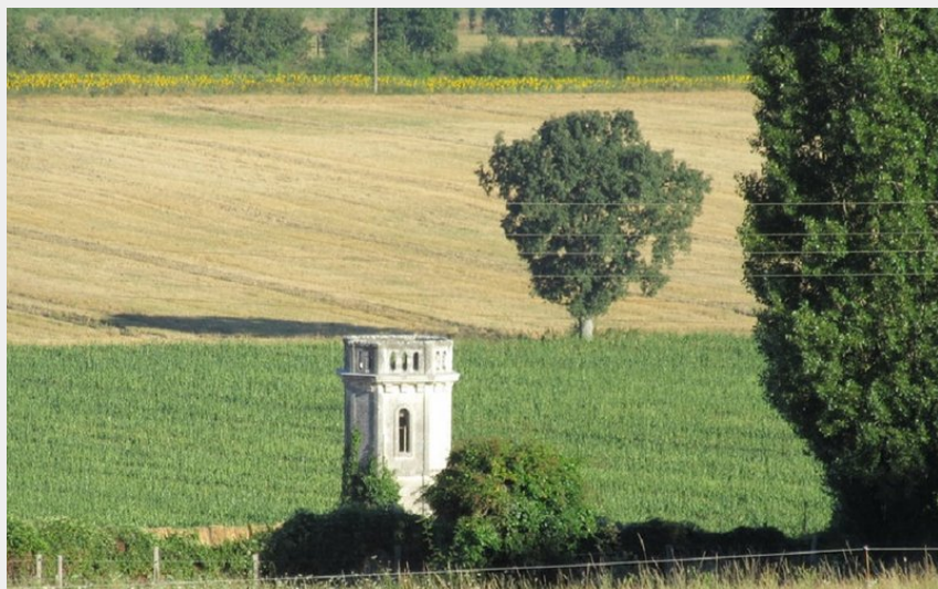
(Mairie de Blou)