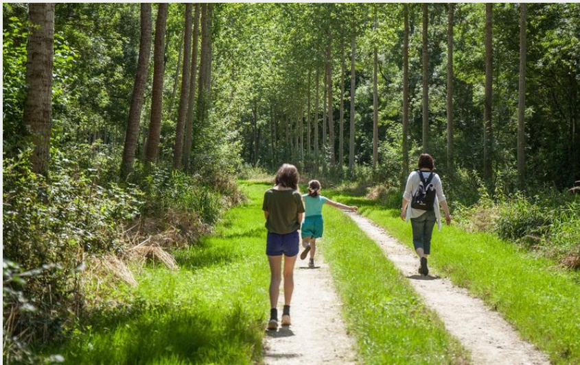
(PNR Loire Anjou Touraine)