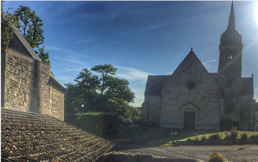
Eglise et Lavoir (Aude Genevoise - SPL SVLT)