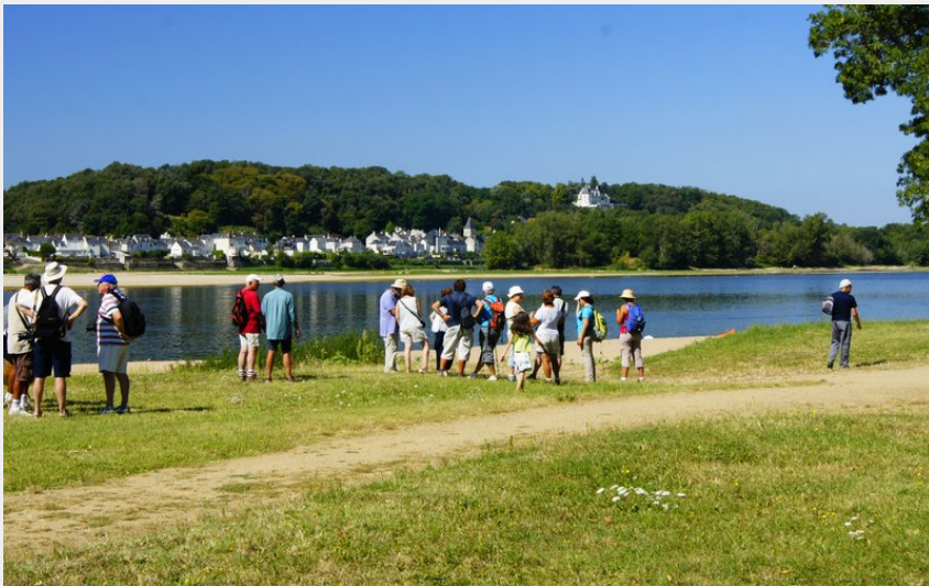
Plage de Loire