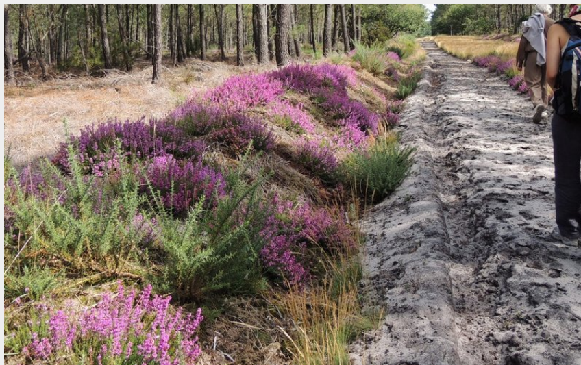
Chemin dans la forêt de Courléon (O.Schoubert)

Balades et randos région de Saumur - Courléon