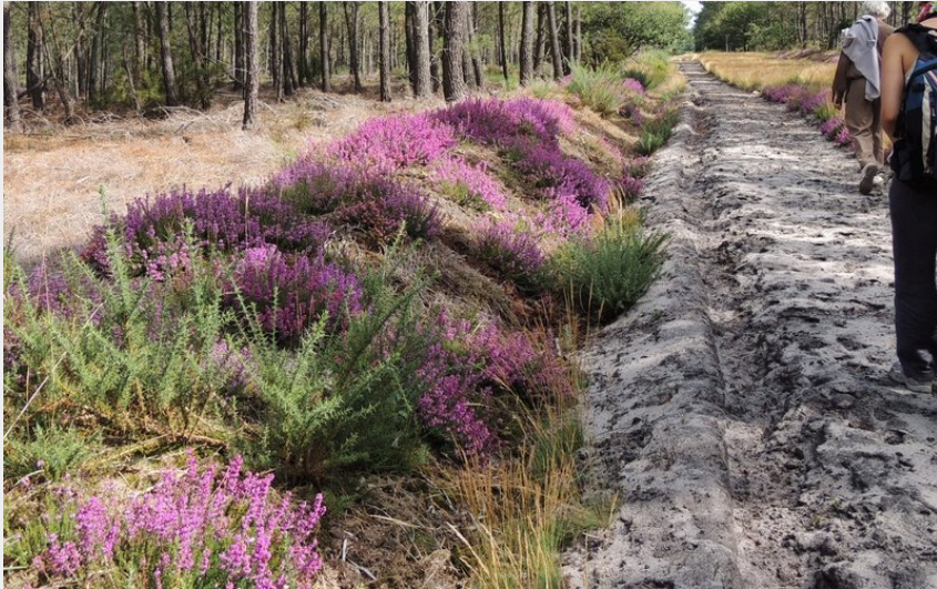
Chemin dans la forêt de Courléon (O.Schoubert)