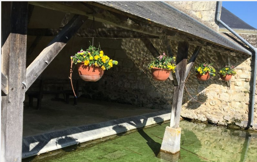
Lavoir de Grézillé (Aude Genevoise - SPL SVLT)

Balades et randos région de Saumur - Gennes-Val-de-Loire